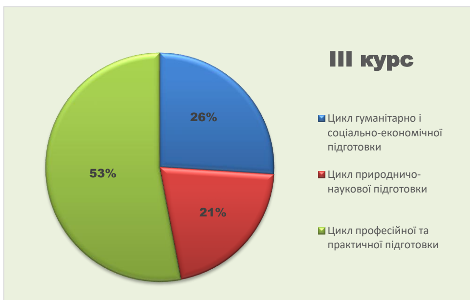
Рис. 2 Діаграма розподілу освітніх компонентів (ОК) в рамках освітньо-професійної програми підготовки фахового молодшого бакалавра зі спеціальності 224 «Технологія медичної діагностики та лікування» спеціалізація «Лабораторна діагностика» III Курс.